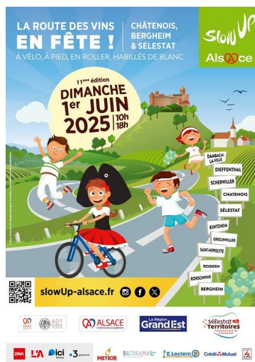
Affiche du Slow Up Alsace 2025