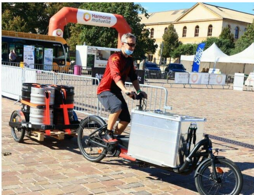
Photo : Les Coursiers de Metz