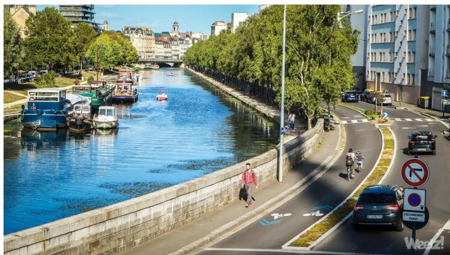
Photo : le Réseau Express vélo de Rennes métropole (source Ouest France)