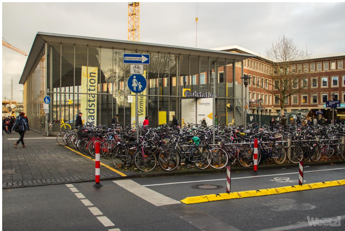
Photo : la station vélo couverte de la gare de Munster en Allemagne